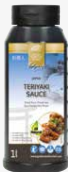
Terriyaki Sauce 1l per Flasche