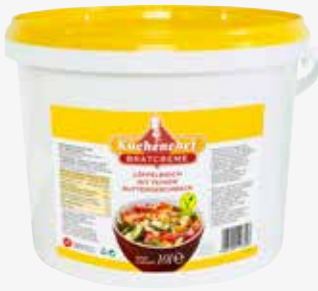
Küchenchef Bratcreme 10 kg per Eimer