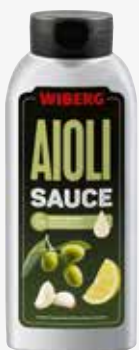
Wiberg Aioli Sauce 730 g per Flasche