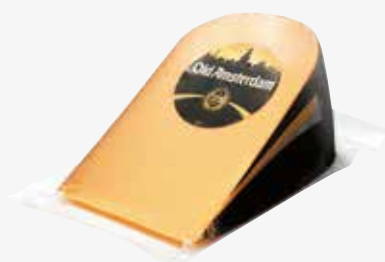
Old Amsterdam NED ca. 900 g per kg