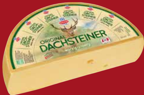
Tilsiter Dachsteiner AT 45 %, ca. 3,5 kg per kg