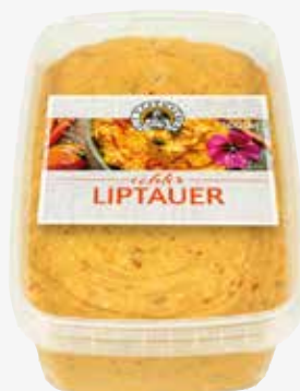
Die Käsemacher Liptauer 45 %, 1 kg per Becher