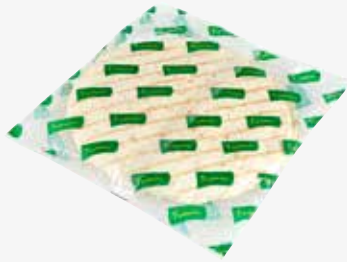
Mautner Funtastic Tortillas Grilled ø 30 cm, 18 Stück per Packung