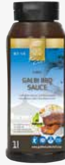
Galbi BBQ Sauce 1l per Flasche