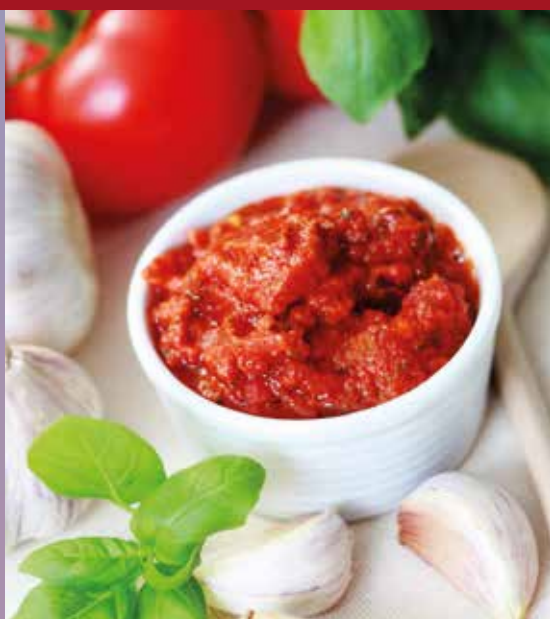
Pesto's von Hügli