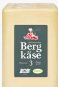
Alma Bergkäse Block DE, 3 Monate gereift 45 %, 1-2 kg per kg