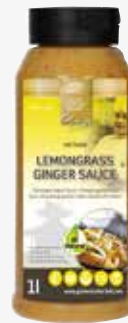
Zitronengras Ingwer Sauce 1l per Flasche