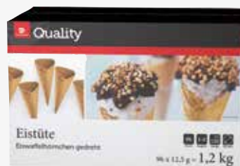
Quality Waffeltüten 96 Stück, 1,2 kg per Karton