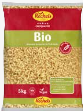
Recheis BIO Hörnchen glatt 5 kg per Sack