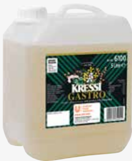
Knorr Kressi Essig 5 l per Kanister