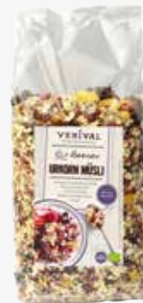
Verival BIO Müsli Beeren-Urkorn 1.300 g per Packung