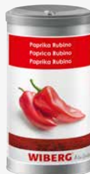
Wiberg Paprika Rubino 1.200 ccm per Dose