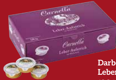
Darbo Leberaufstrich 60 Stück per Packung