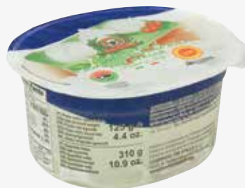
Galbani Büffelmozzarella Tre Stelle IT 125 g per Becher