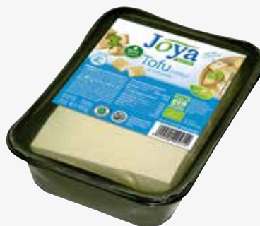
Joya BIO Tofu Natur AT 500 g per Packung