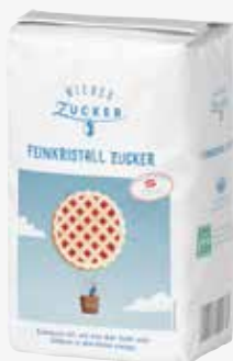
Feinkristallzucker 1 kg per kg