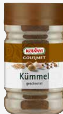
Kotanyi Kümmel geschrotet 1.200 ccm per Dose