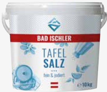
Gustosal Speisesalz jodiert 10 kg per Eimer