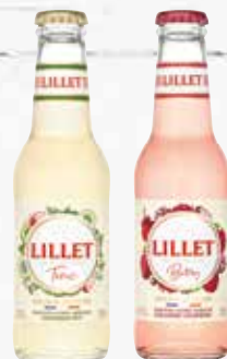
Lillet Tonic oder Berry Rosé ready to drink 0,2 l, 5 % per Flasche