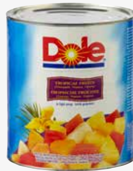
Dole Tropical Gold Fruchtcocktail 3.100 ml per Dose