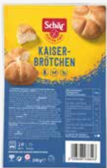
Dr. Schär Kaiserbrötchen 240 g per Packung