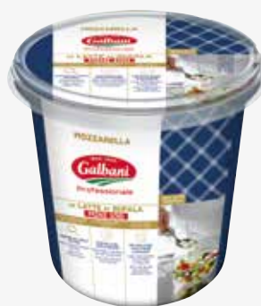
Galbani Büffelmozzarella mini IT 500 g per Becher