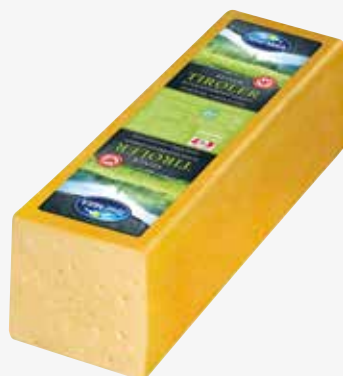
Tirol Milch Feiner Tiroler 55 %, ca. 3 kg per kg