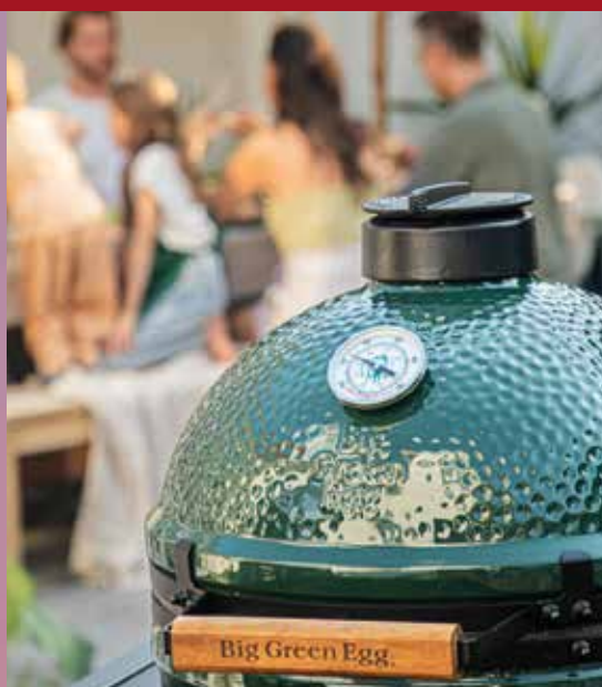
Big Green Egg