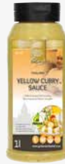
Gelbes Curry Kochsauce 1l per Flasche