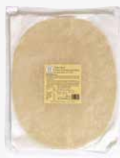
Tante Fanny Gastro Flammkuchen- böden DE, frisch 10 x 130 g per Packung