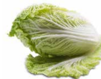
Chinakohl Klasse I, Tirol per kg