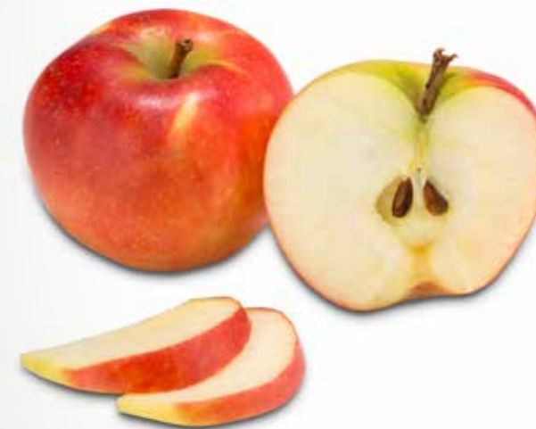
Elstar Äpfel Klasse I 13 kg per Kiste