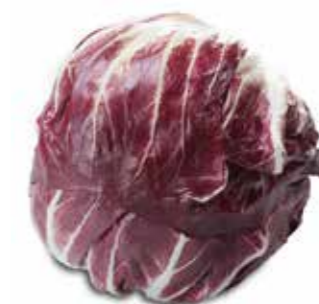
Radicchio Klasse I, Tirol per kg