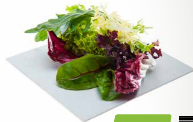
Salat Spezial 500 g per Packung