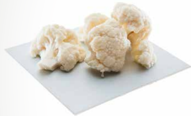
Karfiol Röschen 1 kg per Packung