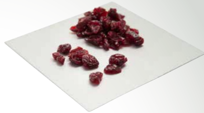
Cranberries 2 kg per Eimer

Tägliche Verarbeitung garantiert absolute Frische!