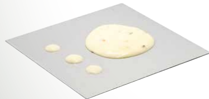
Sahnesauce 5 l per Eimer