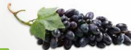
Trauben blau Klasse I ca. 5 kg per Kiste