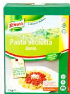
Knorr Pasta Basis 3 kg per Karton