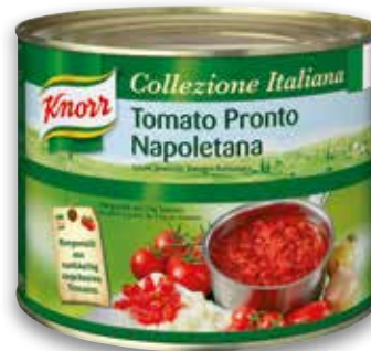
Knorr Tomato Pronto Napoletana 2 kg per Dose