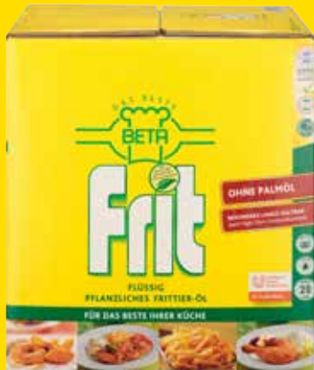
Beta Frit Box 20 l per Box