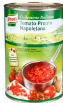
Knorr Tomato Pronto Napoletana 4,15 kg per Dose