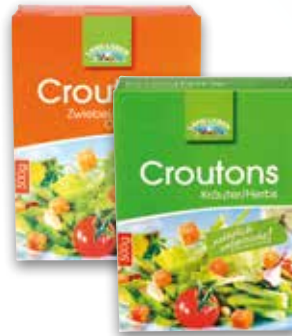
Land-Leben Crotons 500 g diverse Sorten per Packung