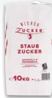
Wiener Staubzucker 10 kg per Sack