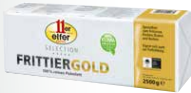
11er Frittierfett 2,5 kg per Packung