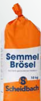
Scheidbach Semmelbrösel 10 kg per Sack