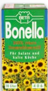
Beta Bonella Sonnenblumenöl 10 l per Box