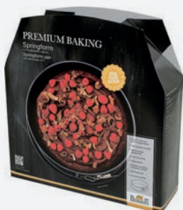
Birkmann Premium Baking Springform ø 28 cm per Stück