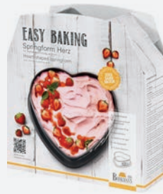
Birkmann Springform Herz antihaft 22 cm, H: 7,5 cm per Stück