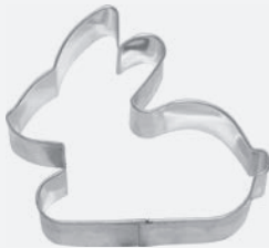
Ausstecher Hase 9 cm per Stück