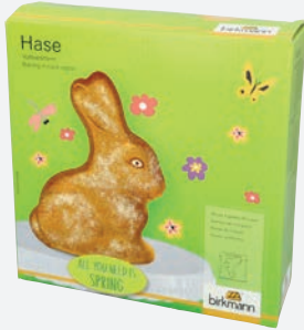
3D Backform Hase mit Antihafbeschichtung 24×24 cm per Stück