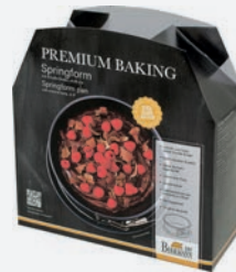
Birkmann Premium Baking Springform ø 20 cm 20 cm, H: 9 cm, 1.800 ml per Stück