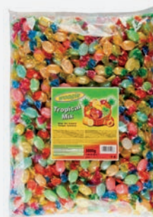
Woogie Bonbons Tropical Mix 3 kg per Packung