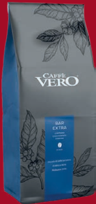
Caffe Vero Bar Extra 1 kg per Packung