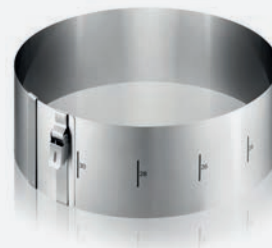
GEFU Tortenring verstellbar H: 10 cm Edelstahl mit Clip per Stück