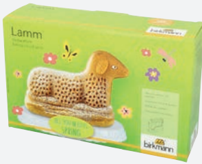
3D Backform Lamm mit Antihafbeschichtung 26,5×16,5 cm per Stück