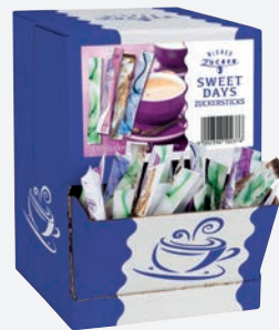
Bistrozucker Sticks 4g, 500 Stk. per Karton