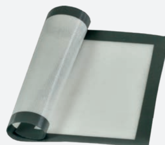
Silikomart Backmatte Fiberglas 52×31,5 cm per Stück