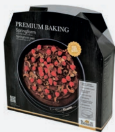
Birkmann Premium Baking Springform antihaft ø 26 cm per Stück