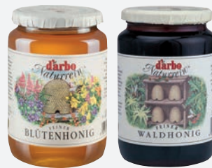
Darbo Honig Blüten und Wald 1.000 g per Glas