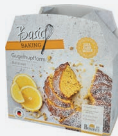
Birkmann Gugelhupfform antihaft ø 24 cm per Stück