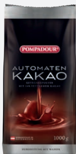
Pompadour Automatenkakao 1 kg per Packung