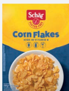
Schär Cornflakes 250 g per Packung