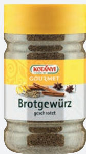
Kotanyi Brotgewürz 1.200 cm per Dose