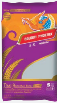
Golden Phoenix Thai Jasminreis 5kg per Sack