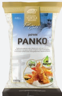
Golden Turtle Chef Panko Brotkrumen 1kg per Sack