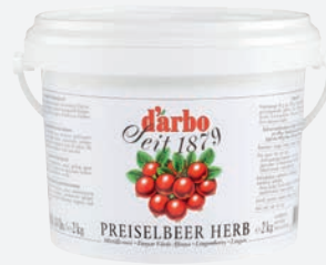
Darbo Preiselbeer herb 2kg per Eimer