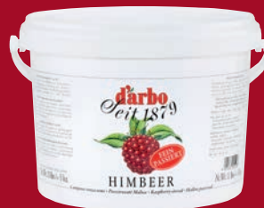
Darbo Fruchtaufstrich Himbeer 5kg per Eimer