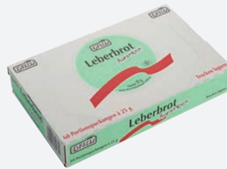
Ham Leberbrot Aufstrich 60x25g per Karton