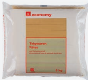
Economy Spaghetti 5kg per Packung