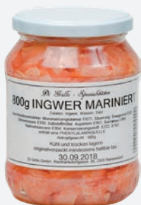
Ingwer mariniert 800g per Glas