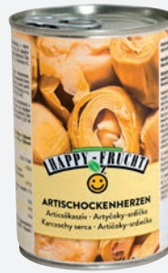
Happyfrucht Artischockenherzen 390g per Dose