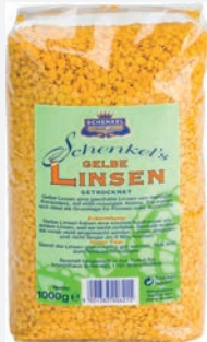
Schenkel Linsen gelb 1kg per Packung